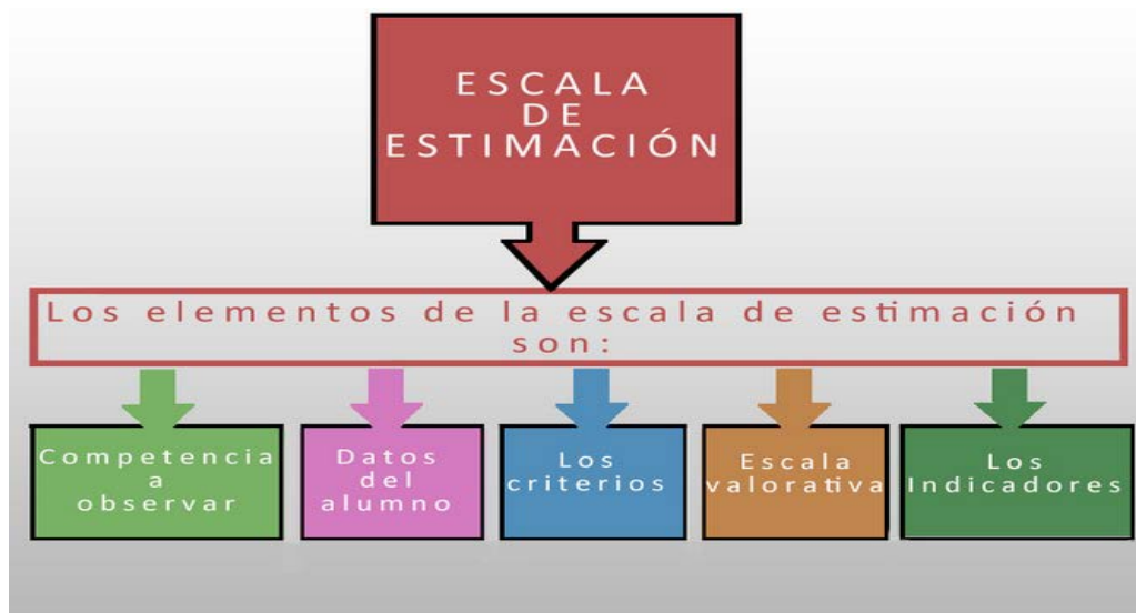
Figura 5. Elementos de la escala de estimación.

Los elementos a tener presentes en la escala de estimación son los que aparecen en la figura 5: